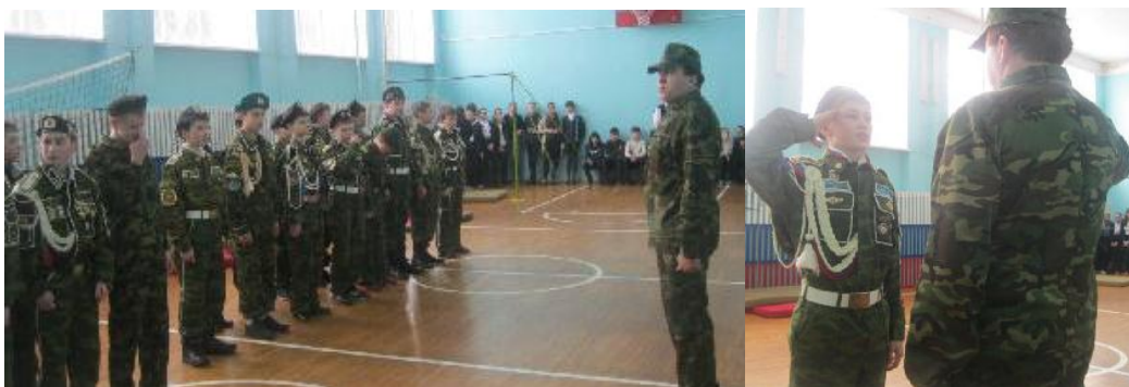
«А ну-ка,мальчиши 7-8 классов»