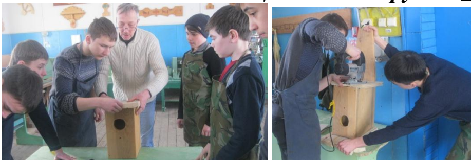
Учащиеся 8-х классов